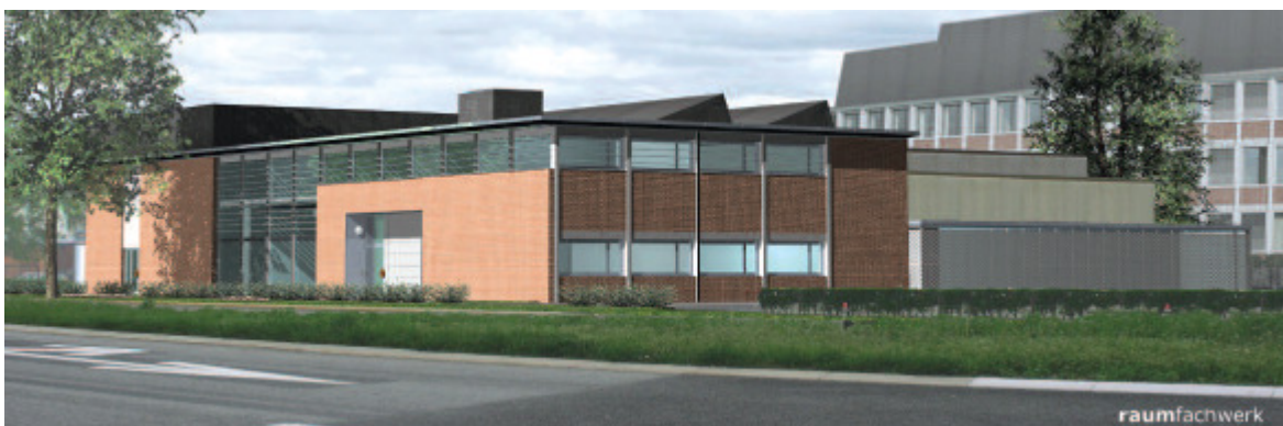
Das neue Motorenhaus am Empa-Standort Dübendorf von der Überlandstrasse aus gesehen.